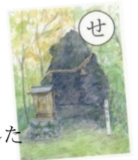
背比べ 鬼が残した 重ね岩

9:00 中央公民館/出発 → バス → 9:10~9:40 ガラリー山恵 → バス → 9:50 中央公民館/到着 → 10:00 ~ 12:00 休憩 → 鬼飛山の紹介/かるたイベント → 解散