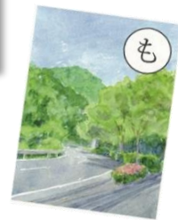
桃太郎の 伝説残る 鬼飛山

9:00 中央公民館/出発 → バス → 9:10~ 鬼飛山(山楠公園) / 「た」「せ」「も」 → 12:30 大谷公園 → バス → 中央公民館 → 解散